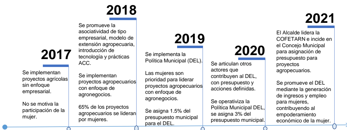
Ilustración 2. Cambios Importantes Observados en la UDEM Palestina de Los Altos